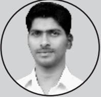
வா. வீரப்பன், தொ. ப. ஆ, அரசு தொடக்க பள்ளி, அய்யங்குட்டிப்பாளையம்