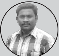
நல். கருணாநிதி, தொ. ப. ஆ, அரசு தொடக்க பள்ளி, அனந்தபுரம்